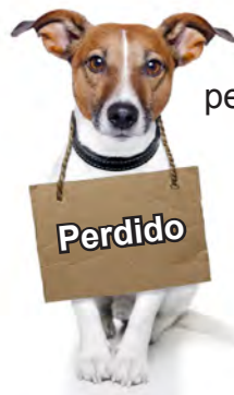
perro perd ido lost dog