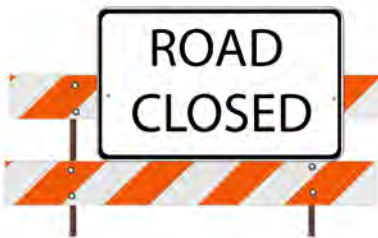
calle cerr ada road closed

El participio acompaña a verbos y a sustantivos en una oración. Es muy importante que el participio coincida en género y número con el sustantivo de la oración. The past participle is attached to verbs and nouns in a sentence. It is very important the past participle agrees in gender and number with the noun of the sentence.