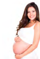
La mujer está embarazada . The woman is pregnant.