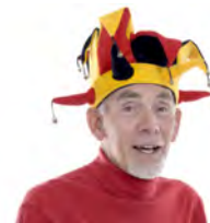
Mi abuelo es divertido . My grandfather is fun.