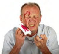
El hombre está herido . The man is hurt.