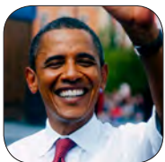
persona importante: presidente