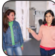
ella - She