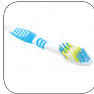
cepillo de dientes