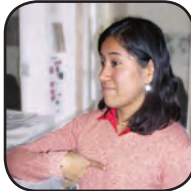
yo - I