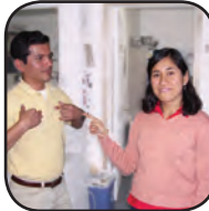
él - He