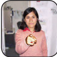
tú - usted You